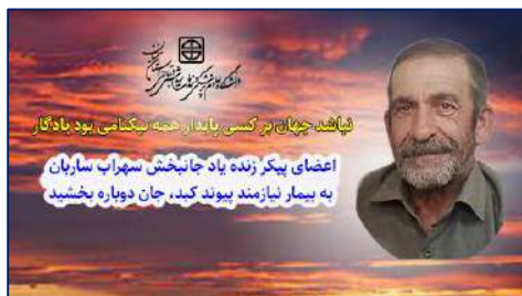
اعضای پیکر زنده یاد جانبخش سهراب ساریان به بیمار نیازمند پیوند کبد، جان دوباره بخشید ۱۴۰۱/۰۱/۱۶