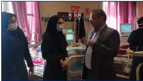
حضور سرپرست معاونت غذا و داروی دانشگاه در بیمارستان معتمدی گرمسار ۱۴۰۲/۰۱/۲۸