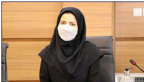
صدور احکام جدید حقوقی کارکنان دانشگاه ۱۴۰۲/۰۱/۳۰