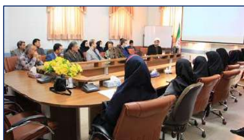
کارگاه آموزشی با موضوع " جوانی جمعیت " در شبکه بهداشت و درمان شهرستان گرمسار ۱۴۰۲/۰۱/۲۱