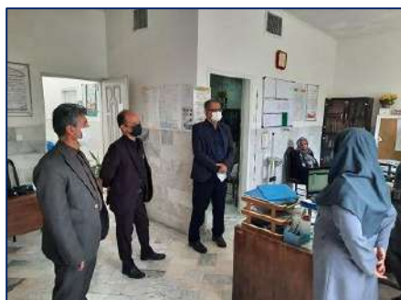
بازدید معاون بهداشتی دانشگاه از مراکز خدمات جامع سلامت مومن آباد و شهدای سرخه ۱۴۰۲/۰۱/۲۲