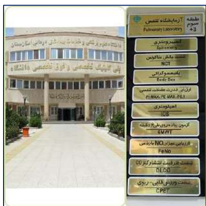
مراجعه حدود ۲ هزار بیمار به آزمایشگاه تنفس کلینیک تخصصی و فوق تخصصی کوثر ۱۴۰۲/۰۱/۲۸