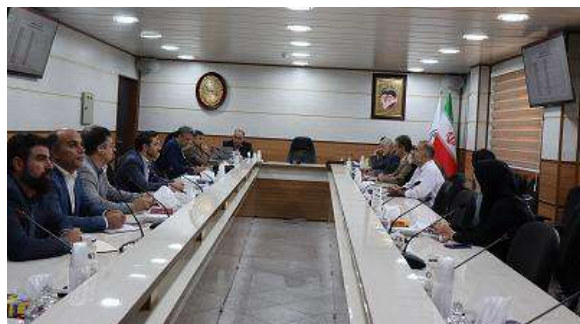
کارشناسی با رویکرد بررسی چالش های حوزه معاونت توسعه به صورت مستمر برگزار شود.