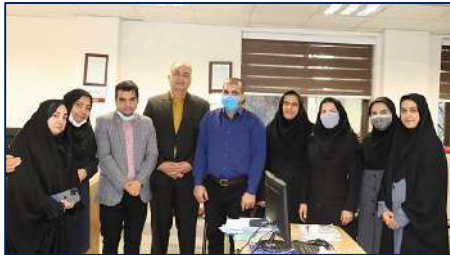
قدردانی از کارکنان منابع انسانی و توسعه سازمان و تحول اداری دانشگاه توسط معاون توسعه مدیریت، منابع و برنامه ریزی دانشگاه ۱۴۰۲/۰۱/۲۸